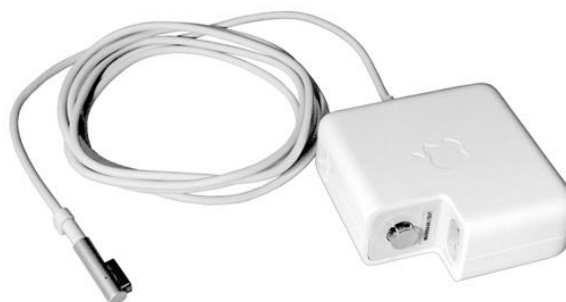
85 W MagSafe-strømforsyning med "L"-stiktype

MacBook Pro (15", medio 2012) MacBook Pro (15", ultimo 2011) MacBook Pro (17", ultimo 2011) MacBook Pro (15", primo 2011) MacBook Pro (17", primo 2011) MacBook Pro (15", medio 2010) MacBook Pro (17", medio 2010)