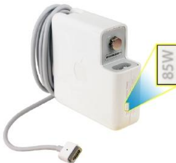
85 W MagSafe-strømforsyning med "T"-stiktype

MacBook Pro (15", medio 2009) MacBook Pro (17", medio 2009) MacBook Pro (17", primo 2009) MacBook Pro (15", ultimo 2008) MacBook Pro (17", ultimo 2008) MacBook Pro (15", primo 2008) MacBook Pro (17", primo 2008) MacBook Pro (15" 2,4/2,2 GHz) MacBook Pro (17", 2,4 GHz) MacBook Pro (15" Core 2 Duo) MacBook Pro (17" Core 2 Duo) MacBook Pro (15" blank) MacBook Pro (17") MacBook Pro