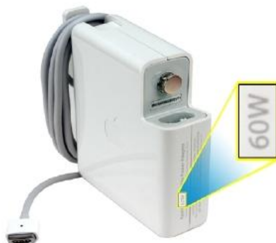
60 W MagSafe-strømforsyning med stiktype "T"

MacBook Pro (13", medio 2009) MacBook Pro (15", 2,53 GHz, medio 2009) MacBook (13", medio 2009) MacBook (13", primo 2009) MacBook (13", aluminium, ultimo 2008) MacBook (13", ultimo 2008) MacBook (13", primo 2008) MacBook (13", ultimo 2007) MacBook (13", medio 2007) MacBook (13", ultimo 2006) MacBook (13")