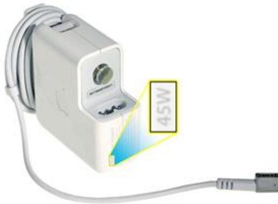
45 W MagSafe-strømforsyning med stiktype "L"

Bemærk: Strømforsyninger, der fulgte med MacBook Air (original), MacBook Air (ultimo 2008) og MacBook Air (medio 2009), anbefales ikke til brug sammen med MacBook Air (ultimo 2010)-modeller. Brug om muligt din computers originale strømforsyning eller en nyere strømforsyning.