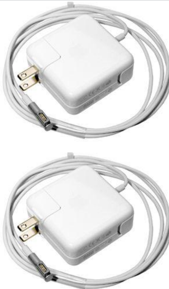
45 W MagSafe-strømforsyning med stiktype "L"

MacBook Air (13", medio 2011) MacBook Air (11", medio 2011) MacBook Air (13", ultimo 2010) MacBook Air (11", ultimo 2010)