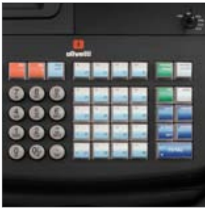
FARVE OPDELT FUNKTIONSTASTER og direkte adgang til 40 varegrupper